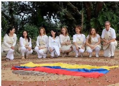
Los artistas llegan a la ciudad con la muestra "Paz & Peace".

cialmente, desde un punto de vista compositivo, instalativa, multidimensional, puesto que comprende dos puntos focales unidos por un vector, una pantalla y un lente. En ese microsegundo migratorio la obra se descompone en luz, viaja, desaparece, como un ciclo silencioso entre lo eterno y lo efímero. La suya es una propuesta que se afina en una intercepción.